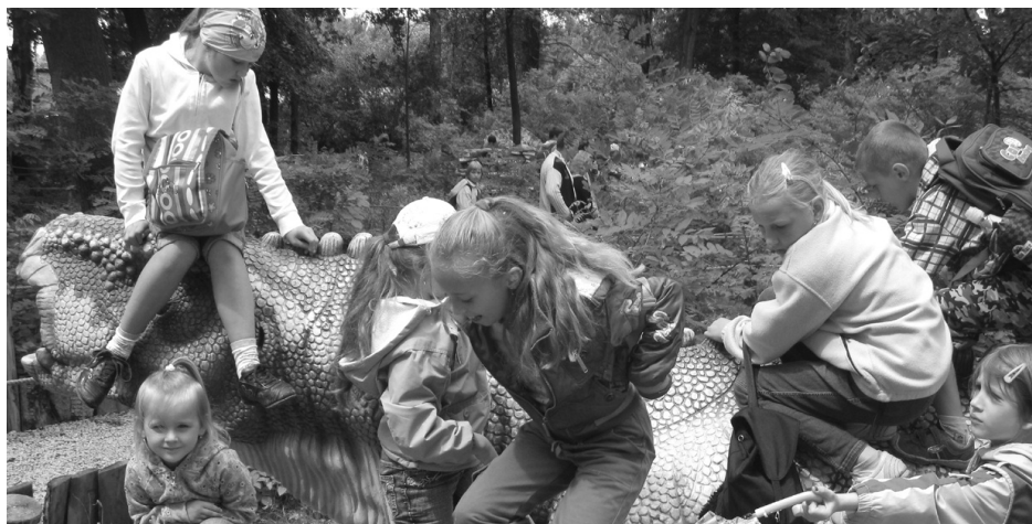
Podczas turnusu dzieci zwiedziły Kopalnię Srebra w Tarnowskich Górach, były na ba-

II- gi turnus również 3 tygodniowy trwał od 20 lipca do 7 sierpnia a finansowany był ze środków Gminnej Świetlicy Środowiskowej.