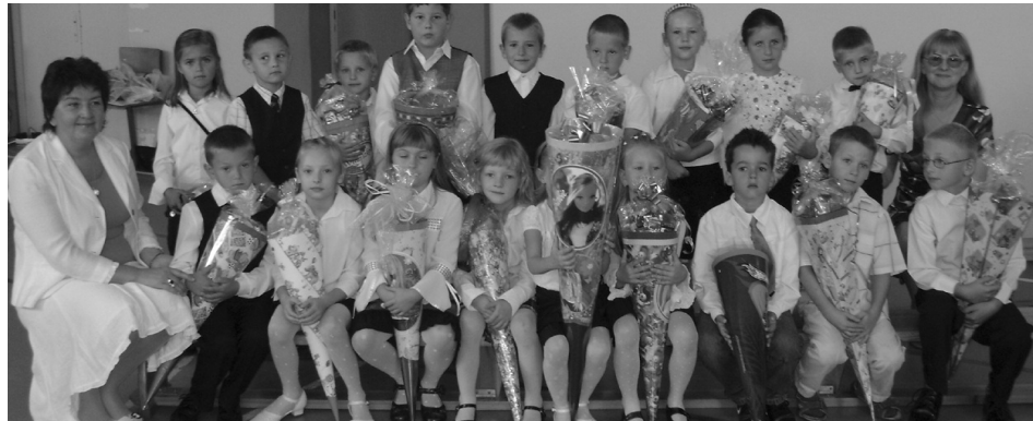
Rozpoczęcie roku szkolnego - klasa I a